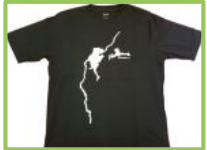
Klettershirt neu - Vorderansicht

Material: Aluminium, nicht zum Sichern geeignet