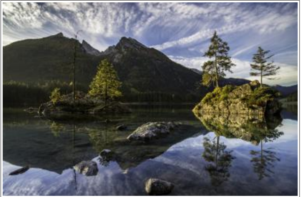
Siegerbild: Erich Lebherz - Hintersee - 50 Pkt.