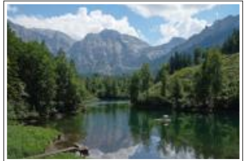
Hans Ecker - 39 Pkt.