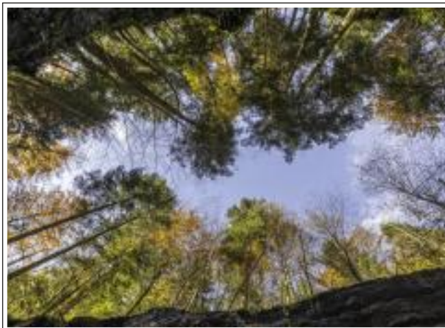
Erich Lebherz - 42 Pkt.