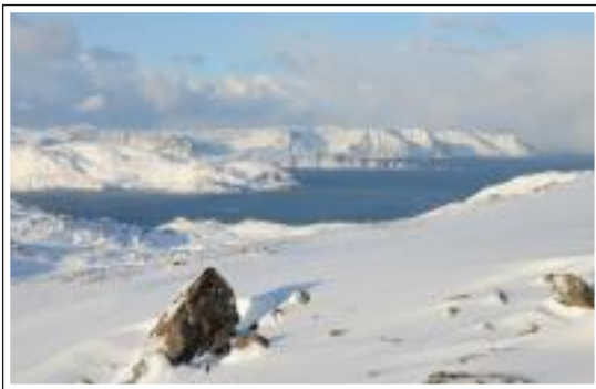
Rudi Wittberger - Eiskalt - 44 Pkt.