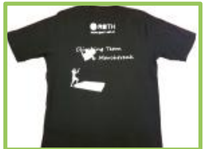
Klettershirt neu- Rückansicht