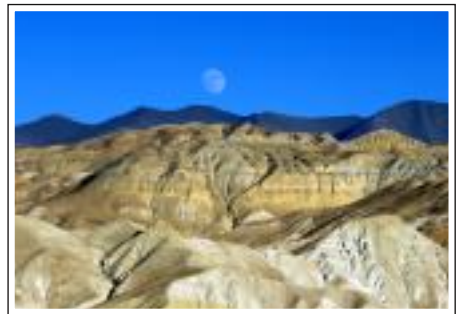
Udo Paschinger - Mondlandschaft - 39 Pkt.